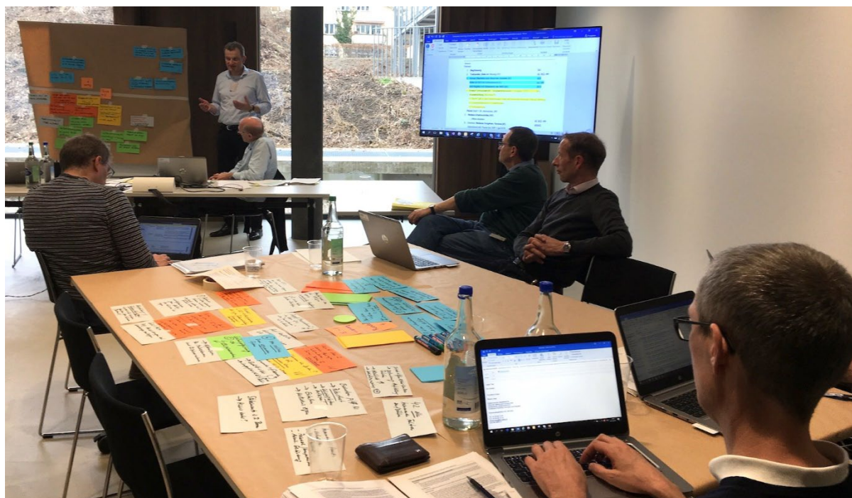
Abbildung 1: Abschluss durch den 4. Workshop mit der Begleitgruppe, 6. März 2019

Die Resultate basieren auf einer umfangreichen Datenanalyse und auf der Befragung