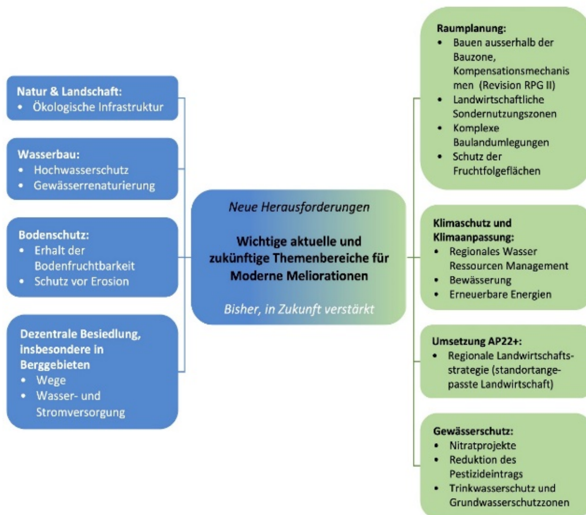
Abbildung 2: Wichtige aktuelle und zukünftige Themenbereiche für Moderne Meliorationen

Das Zielsystem von Modernen Meliorationen gliedert sich in die 3 Hauptziele «Erhalten und Fördern einer nachhaltigen Landwirtschaft», «Erhalten, Pflegen und Aufwerten der Kultur- und Naturlandschaft und Aufwerten des Landschaftsbildes» sowie «Unterstützen der Realisierung von öffentlichen und privatrechtlichen Anliegen». Die